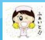
「アカデミちゃん」スタンプ第4弾！

頑張る看護師・看護学生を応援！東京アカデミーオリジナルキャラクター「アカデミちゃん」のLINEスタンプ第4弾！さらに、オリジナルキャラクター「デミの助」もLINEスタンプに登場！スタンプの購入はスタンプショップから「東京アカデミー」で検索してください。クリエイターズスタンプにて現在6種類販売しています！