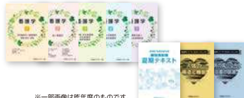
※一部画像は昨年度のものです。