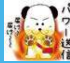
「デミの助」スタンプ