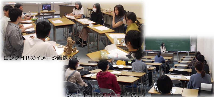
ロングHRのイメージ画像です。