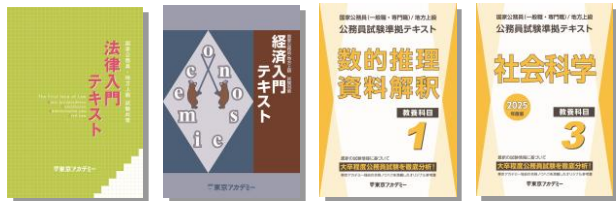
※主な使用教材 (写真は前年度版です)

大卒レベルの学習開始に向けて、まずは教養科目のポイン整理と専門科目の法律と経済学の導入講義を行います。もちろん、教養コースの方も法律科目は教養科目の政治や法学の対策になり、経済学は教養科目の経済の対策になりますので、この時期も、行政コースと教養コース合同で実施していきます。