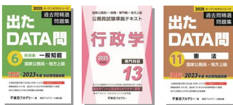
※主な使用教材 (写真は前年度版です)

オリジナル過去問題集「出たDATA問」シリーズも一部併用しながら実践レベルの問題に取り組み、本番に即したテクニックを磨き、アウトプットを行いながら知識の定着を図ります。