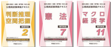
※主な使用教材 (写真は前年度版です)

行政コースは専門科目講義では、オリジナルテキスト「公務員試験準拠テキスト」シリーズの使用を開始します! 教養試験・専門試験の頻出分野を効率よく学習し、各科目の重要分野を的確に押さえながら知識のインプットを行います。インプット式の学習により問題演習を行う上で必要な知識の習得、代表的な解法の構築を目指します。