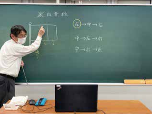
※写真は全て実際の様子です。