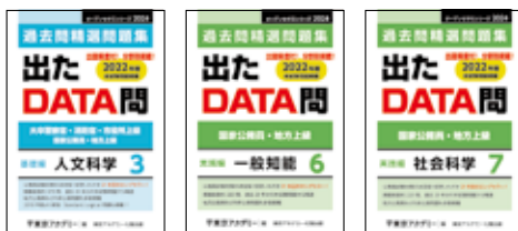
主な使用教材 (写真は2023年度版です)

オリジナル過去問題集「出たDATA問」シリーズを使用します。実践レベルの問題に取り組み、本番に即したテクニックを磨き、アウトプットを行いながら知識の定着を図ります。