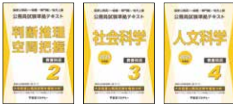
主な使用教材 (写真は2024年度版です)

公務員試験対策スタートとして教養科目全般の基礎知識習得を行います。入門レベルからの対策で安心して受講開始できます。