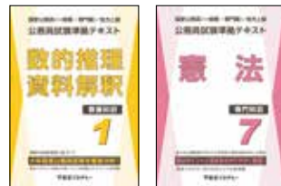
主な使用教材 (写真は2024年度版です)

オリジナルテキスト「公務員試験準拠テキスト」シリーズを主に使用し、教養試験の頻出分野を効率よく学習し、各科目の重要分野を的確に押さえながら知識のインプットを行います。インプット式の学習により問題演習を行う上で必要な知識の習得、代表的な解法の構築を目指します。