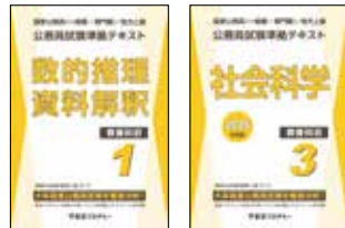
主な使用教材 (写真は2024年度版です)

オリジナルテキスト「公務員試験準拠テキスト」シリーズを主に使用し、教養試験の頻出分野を効率よく学習し、各科目の重要分野を的確に押さえながら知識のインプットを行います。インプット式の学習により問題演習を行う上で必要な知識の習得、代表的な解法の構築を目指します。