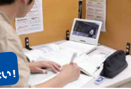
※録画視聴の場合はチャットには対応できません。