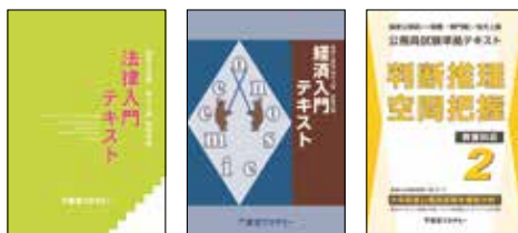
主な使用教材 (写真は2024年度版です)

公務員試験対策スタートとしてまずは、教養科目全般の基礎知識習得を行います。また、専門の法律科目、経済科目はオリジナル入門テキストを使用し導入講義を行います。入門レベルからの対策で安心して受講開始できます。