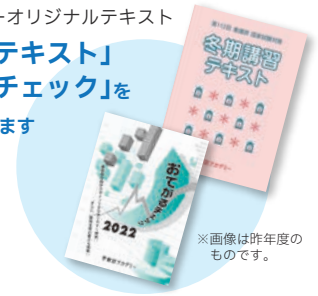
※画像は昨年度のものであります。