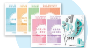
※画像は昨年度のものであります。