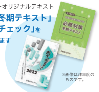
※画像は昨年度のものであります。