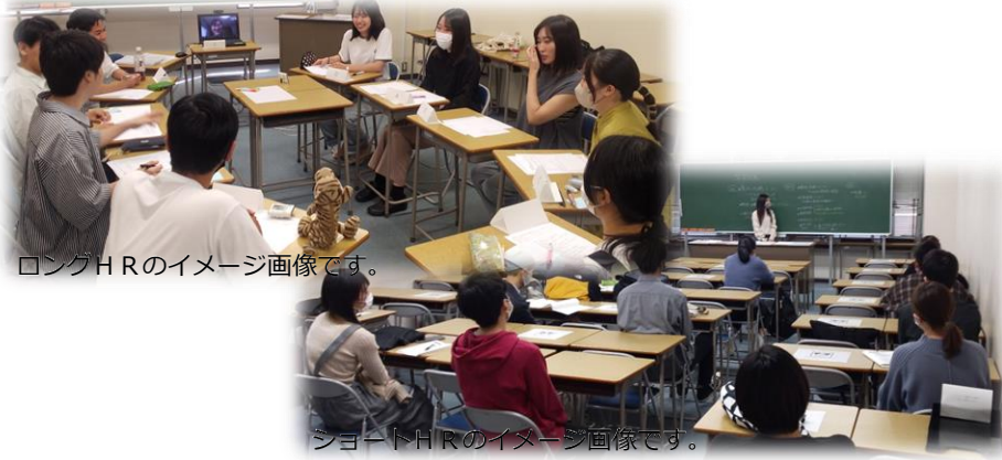
ロングHRのイメージ画像です。