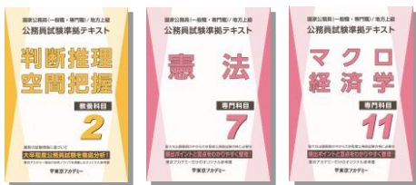
※主な使用教材 (写真は前年度版です)

行政コースは専門科目講義では、オリジナルテキスト「公務員試験準拠テキスト」シリーズの使用を開始します！教養試験・専門試験の頻出分野を効率よく学習し、各科目の重要分野を的確に押さえながら知識のインプットを行います。インプット式の学習により問題演習を行う上で必要な知識の習得、代表的な解法の構築を目指します。