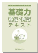
※主な使用教材 (写真は前年度版です)

※4月上旬～5月スタート入門講座開始までは週1回程度一般知能の対策を特典講義(オンラインのみ)として行います。