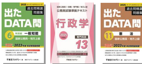
※主な使用教材 (写真は前年度版です)

オリジナル過去問題集「出たDATA問」シリーズも一部併用しながら実践レベルの問題に取り組み、本番に即したテクニックを磨き、アウトプットを行いながら知識の定着を図ります。