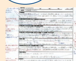
▲過去合格者の面接カード添削例