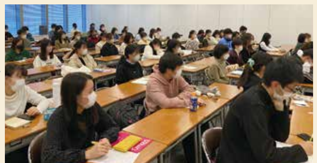
※写真は全て実際の様子です。

受講期間中、時期に合わせて最終合格までに必要な道筋を、 一つひとつ解説していきます。