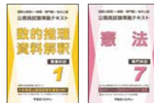
主な使用教材(写真は2024年度版です)

オリジナルテキスト「公務員試験準拠テキスト」シリーズを主に使用し、教養試験の頻出分野を効率よく学習し、各科目の重要分野を的確に押さえながら知識のインプットを行います。インプット式の学習により問題演習を行う上で必要な知識の習得、代表的な解法の構築を目指します。