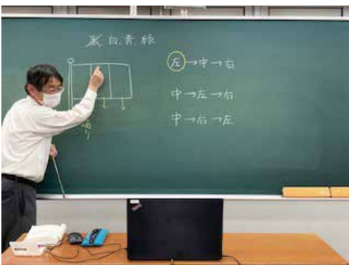
※写真は全て実際の様子です。