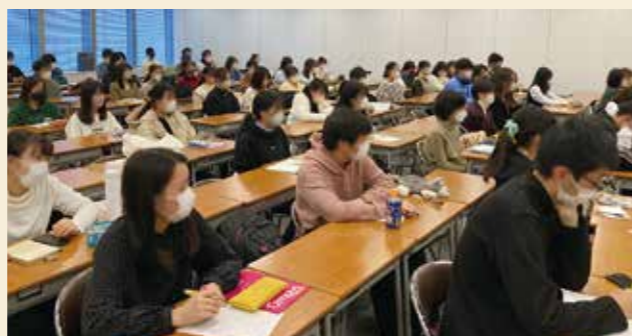
※写真は全て実際の様子です。

教務スタッフとは異なる目線で、受験のリアルを伝え、受講生を励まし、支えてくれる頼もしい存在です。 受講生の高いモチベーションにつながっています。