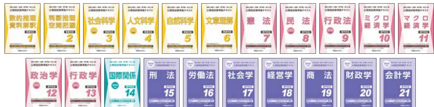
(1～14は2024年度版、15～21は2023年度版)