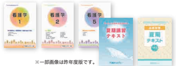
※一部画像は昨年度版です。