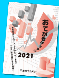
※テキスト画像は 昨年度版です。