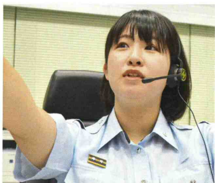
指令係 主事 (平成28年採用)

私達が暮らす地域社会は男女それぞれ半数ずつです。公助を担う消防において、多くの女性が参画、活躍することで市民への対応力や地域防災力の向上が期待されています。体力面などに不安を抱える方もいるかと思いますが、消防の仕事はチームワークが大切です。そして、女性のみなさんの力を必要としています。ぜひ一緒に消防を盛り上げていきましょう。