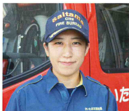
指導係 主事 (令和2年採用)

「消防士」という仕事を調べると、様々な面で不安になると思います。ですが、今では女性も活躍できる職業です。消防の業務は、現場活動だけでなく、火災を予防する業務や119番通報を受ける業務など、現場を支える業務もあります。まずは、勇気を出して一歩踏み出し、ぜひ私たちと一緒に働きましょう。