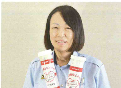
救急課 課長 (平成2年採用)

消防はやりがいがあり、女性が働く上でも環境や制度が整っていて働きやすい職場です。実は女性消防士の夜間勤務が可能となり夜間も現場活動に従事できるようになったのは、平成6年のことで30年にも満たないのです。消防士を目指している皆さん、一緒に女性消防士の活躍する場を広げていきましょう。