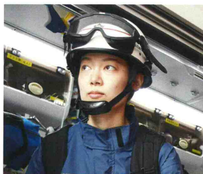
救急係 主事 (平成31年採用)

消防の仕事は皆さんが想像している以上に女性が活躍し、働きやすい職業です。今は不安に思うことがあると思いますが、どこの現場でも仲間がいてサポートしてくれます。是非、チャレンジしてください。消防士を目指すみなさんと、いつか一緒に仕事ができる日を心待ちにしています。