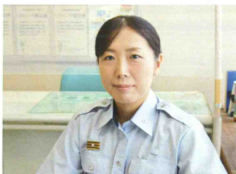
管理指導係 主査 (平成17年採用)

消防はやりがいがあり、女性が働く上でも環境や制度が整っていて働きやすい職場です。実は女性消防士の夜間勤務が可能となり夜間も現場活動に従事できるようになったのは、平成6年のことで30年にも満たないのです。消防士を目指している皆さん、一緒に女性消防士の活躍する場を広げていきましょう。