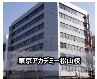
東京アカデミー松山校