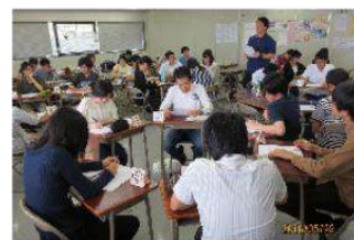
※当日はマスク着用や教室の換気など、新型コロナウイルス感染症対策を講じた上で講義を実施します。