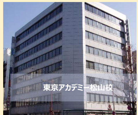
東京アカデミー松山校