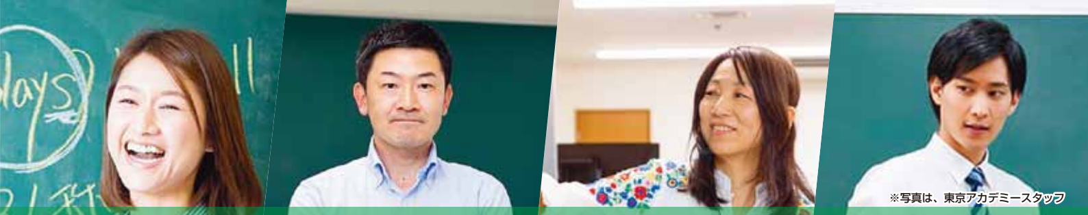
※写真は、東京アカデミースタッフ