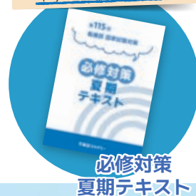
必修対策 夏期テキスト