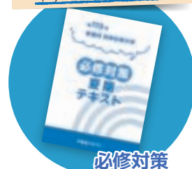
必修対策 夏期テキスト