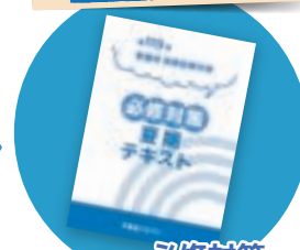
必修対策 夏期テキスト