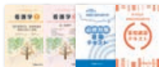
※教材画像は一部昨年度のものです。