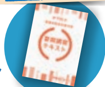
夏期講習テキスト