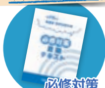
必修対策 夏期テキスト