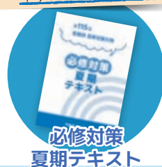
必修対策 夏期テキスト