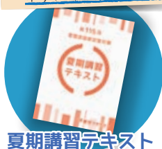
夏期講習テキスト