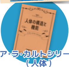
ア・ラ・カルトシリーズ (人体)