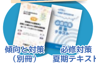
傾向と対策 (別冊) 必修対策 夏期テキスト