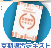
夏期講習テキスト