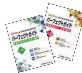
※写真は昨年度のものです。

東京アカデミーは全国32拠点に校舎があり、その情報網は非常に広範囲です。各自治体の情報はもちろんのこと、九州全県、全国規模で集約した情報が蓄積されており、32校どの校舎でも全68自治体(大阪府豊能地区含む)の筆記試験・人物試験の情報を共有しています。その情報は「教員採用試験対策パーフェクトガイドVol.1」等を通して受講生へ提供しています。毎年多くの受講生からいただいた生の情報や、分析した出題傾向を駆使して、受講生の方の受験勉強をバックアップしていきます。さらにはその情報力を活かした併願指導により、他都道府県受験の不安を払拭していきます。