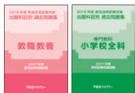
主な使用教材 (過去問題集の写真は2018年度版です)