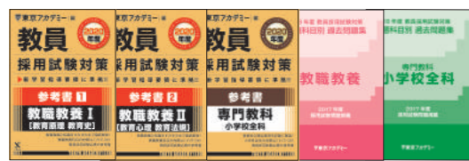
主な使用教材 (過去問題集の写真は2018年度版です)