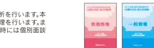
主な使用教材(写真は2018年度版です。)

開講日：2019年4月14日(日) 受講期間：2019年4月14日(日)～2019年5月26日(日) 受講科目：教職教養・人物対策・教職教養教師力向上ゼミ 受講コマ数：総コマ数17回 受講時間数：25.5時間