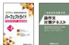
主な使用教材(写真は2018年度版です。)

開講日：2019年8月初旬 受講期間：2019年8月初旬～2019年9月初旬 受講科目：個人面接・論文・模擬授業・面接調査票指導