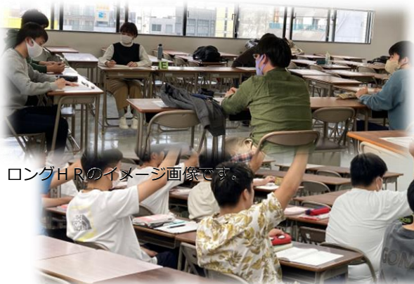
ロングHRのイメージ画像です。